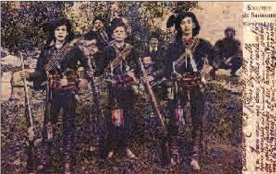
Ένοπλοι νέοι Πόντιοι για την τήρηση της τάξεως στην προσωρινή Κυβέρνηση Τραπεζούντας (1918)

Τουρκία γίνεται το πιο σημαντικό πεδίο δράσης του γερμανικού ιμπεριαλισμού. Κινητήρια δύναμη είναι οι γερμανικές τράπεζες, οι οποίες έχουν κολοσσιαίες επιχειρήσεις στην Ασία.