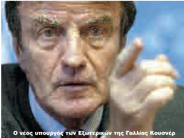
Ο νέος ύπουργός των Έξωτερικών τής Γαλλίας Κουσνέρ

— Ο κ. Κουσνέρ, ως παλιός επαναστάτης και άριστριστής, φαίνεται να μήν επαναπαύεται μέ τό «φιλανθρωπικό» έργο των