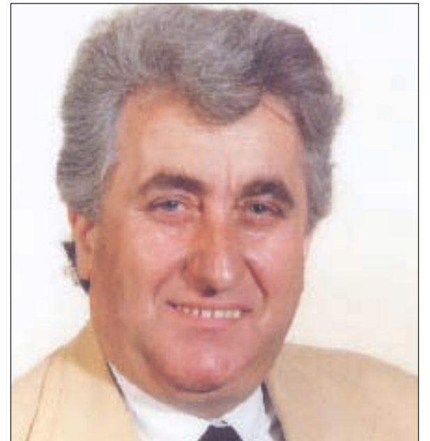
Άπό τά παλαιάμαχα στελέχη της Χ.Δ.