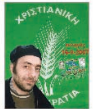
ΣΤΥΛΙΑΝΟΣ ΜΟΥΣΚΟΣ Φωτογράφος