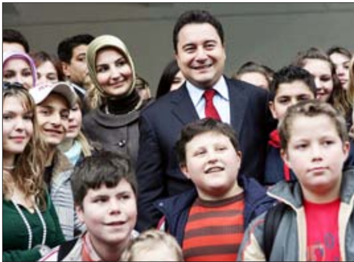
Ό Αλί Μπαμπατζάν στη Θράκη

Έλληνικής Δικαιοσύνης και τής Συνθήκης τής Λωζάννης, καμμία αντίδραση από κυβερνητικά στελέχη. Όταν ή απόφαση κοινοποιήθηκε στό ύπουργείο Έξωτερικών τήν 27.3.2008, ή μόνη απάντηση ήταν αύτη του εκπροσώπου του Γ. Κουμουτσάκου, ό όποιος μέ περισσή