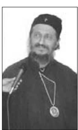
Ὁ κ. Ἀθανάσιος

Τὸ ἀπόγευμα τῆς ἴδιας μέρας ἀνέπτυξε τὴν εἰσήγησή του ὁ Ἐπίσκοπος πρώην Ἐρζεγοβίνης κ. Ἀθανάσιος Γέβτιτς, ὁ ὁποῖος τόνισε ὅτι ἐνίοτε τὴν ἀληθινὴ Μεταμόρφωση τοῦ ἀνθρωπίνου προσώπου ὑποκαθιστοῦν ἡ «ψευδο-μεταμόρφωση» καὶ τὰ προσωπεῖα, τὰ ὁποῖα δίνουν ψευδαίσθηση μεταμορφώσεως. Αὐτὴ τὴν εἰκόνα δίνει ὁ δυτικὸς πολιτισμὸς, ποὺ ἀπολυτοποιεῖ τὴς ἐμφανειακῆς ἀλλαγῆς, ἐνῶ ὁ πολιτισμὸς τῆς Ὁρθόδοξίας ἐκφράζει τὴν ἀληθινὴ μεταμόρφωση