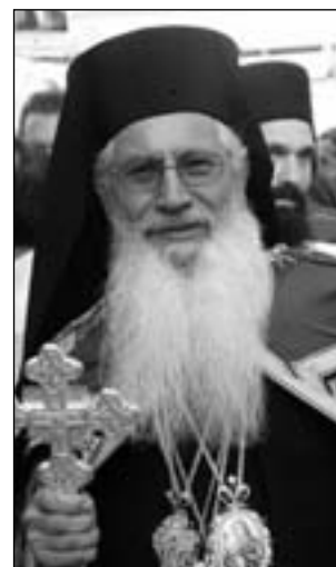
Ὁ κ. Γεώργιος

χῶν. «Ἐπιθυμῶ νὰ γίνουμε πρόσωπα, μιὰ ἐν Χριστῷ οικογένεια. Αἴτημα τῆς ἐποχῆς ἡ Θεῖα λατρεία νὰ συνεχίζεται καὶ μετὰ τὸ «δὶ» εὐχῶν». Ἀπὸ τὸν ἐνθρονιστῆριο λόγο τοῦ τοῦ Σεβ. Μητροπολίτου Θηβῶν καὶ Λεβαδείας κ. Γεωργίου στὴς 22/7/2008. Ἵποσχέσεις... Ἄλλωστε, ὅσοι ἐξοργίζουν τὴ Νέα Τάξη, ἀκόμα καὶ ἂν νομίζουν ὅτι διαπραγματεύονται, εἶναι καταδικασμένοι, ἀφοῦ οἱ δοθεῖσες ὑποσχέσεις ἀποδεικνύονται ἀπατηλές, ὅπως προκύπτει ἀπὸ τὴν ἔγγραφη δήλωση Κάρατζιτς πρὸς τὸ ΔΠΔ, ὅτι εἶχε λάβει ὑποσχέσεις ἀπὸ τοὺς Χόλμπρουκ καὶ Ὀλμπράιτ ὅτι δὲν ἐπρόκειτο νὰ διωχθεῖ. Ἴσως μάλιστα νὰ ἔγινε ἀνεκτὴ ἡ «φυγοδικία» Κάρατζιτς γιὰ τὸσο καιρὸ, προκειμένου νὰ χάσουν τὴν ἀξία