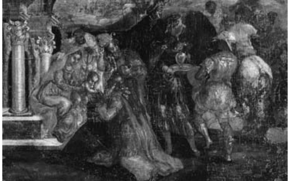
Λεπτομέρεια από προσκύνηση των μάγων (Γρεσκα, Μουσείο Μπενάκη)

Αυτά είναι τα έσχατα όριά μας: Η προσωπική ένωση μετὰ του Τριαδικού Θεού! Και η Γέννησις του Χριστοῦ δεν μας υπόσχεται μίαν χιμαίρικὴν μακαριότητα ή μίαν αφηρημένην