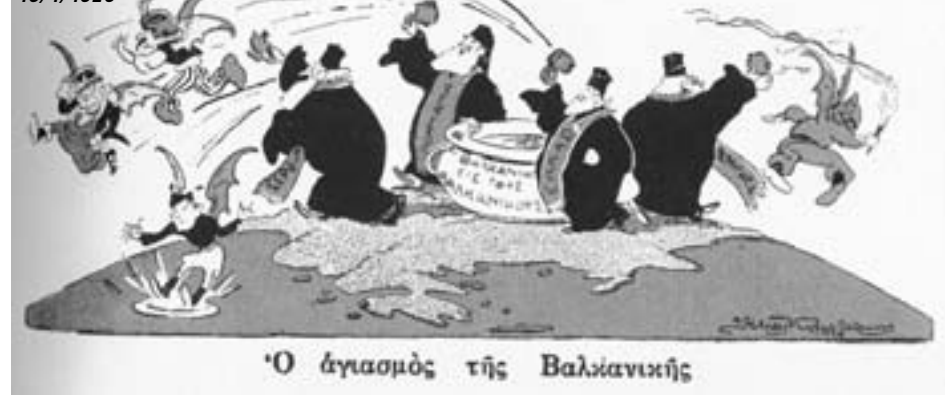
Σκίτσο τοῦ Ἡλία Κουμμεντάκη, Ἐφημ. «Πρωΐα» 10/1/1928

βλήματα ποὺ δημιουργοῦνταν ἀπὸ τὸν τρόπο μὲ τὸν ὁποῖο λειτουργοῦσαν τὰ Μοναστήρια. Ἔτσι, μὲ μιὰ σειρά κανόνων τῆς Ζ' Οἰκουμενικῆς Συνόδου διευκρινίστηκαν μεταξύ ἄλλων καὶ θέματα σχετικὰ μὲ τὴ διαχείριση τῆς μοναστηριακῆς παρουσίας, καθὼς καὶ τὰ πλαίσια τῆς οικονομικῆς δραστηριότητος τῶν Ἱερῶν Μονῶν. Ἡ σημερινὴ κρίση, ποὺ προκλήθηκε μὲ τὴν ὑπόθεση τῆς Ἱερᾶς Μονῆς Βατοπεδίου, μπορεῖ νὰ ἀποτελέσει ἀφορμὴ νὰ δοθῶν ἀνάλογες κατευθύνσεις καὶ διευκρινίσεις ἀπὸ τὴν ποιμαίνουσα Ἐκκλησία.