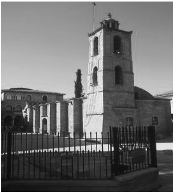
Ο καθεδρικός ναός του Αγίου Ιωάννου του Θεολόγου στη Λευκωσία