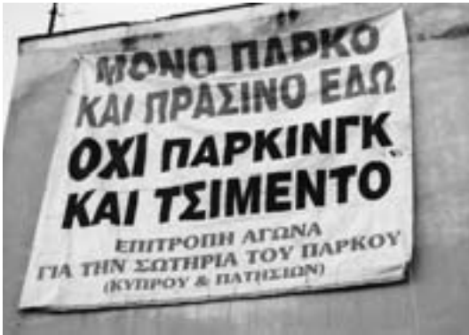
Θύμα της «ανάπτυξης» και το πάρκο στην Πατισίων. Άλλο πάρκινγκ και άλλο πάρκο, κ. Ν. Κακλαμάνης...

Ομίλου, να ξηλωθούν παλαιές και νέες περιφράξεις και να ματαιωθεί κάθε απόπειρα τσιμεντοποίησης του χώρου